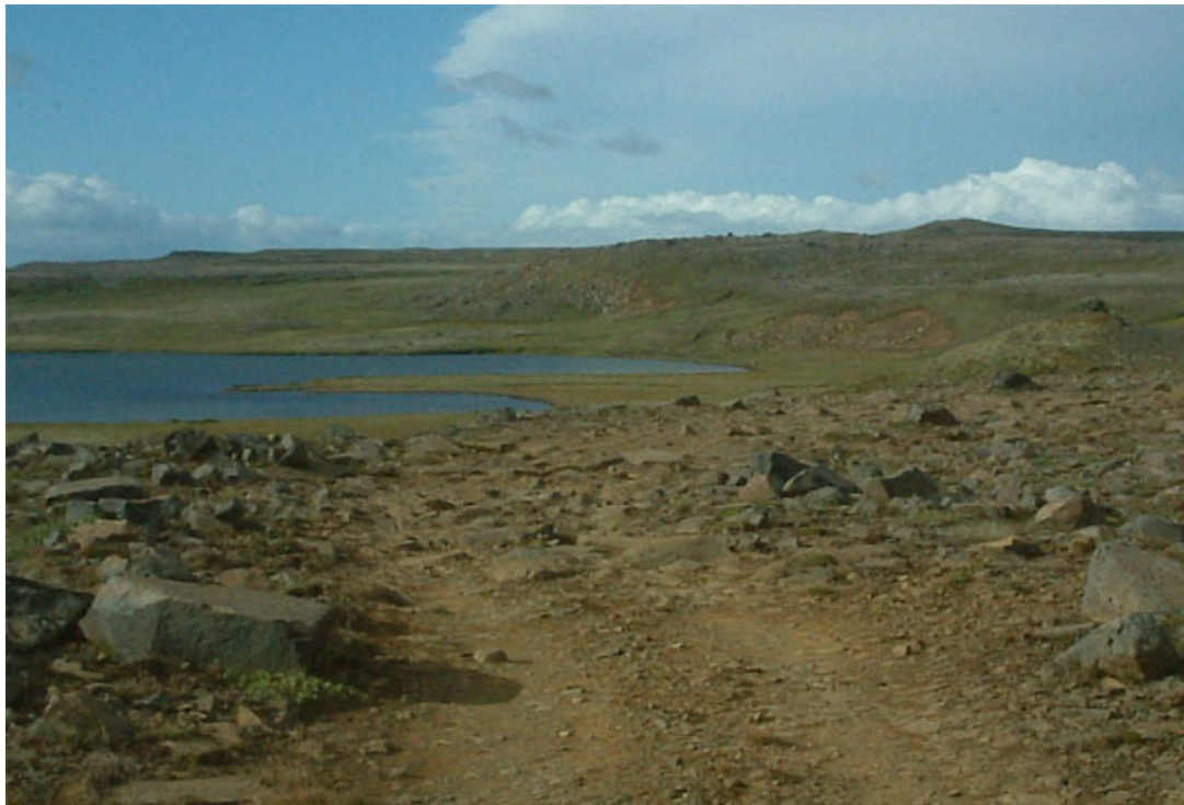
Horft niður í Grettisvík í Arnarvatni stóra

Stærð svæðis hefur mikil áhrif á verðmæti þess sem víðerni. Því stærra sem víðernið er því verðmætara er það. Í hagfræði er hugtakið samlegðaráhrif notað til að lýsa þessu. Tveir hlutar eru almennt verðmætari sem ein heild en summan af verðmætum hvors hluta fyrir sig. Á sama hátt geta verðmæti víðernis minnkað margfalt meira en sem nemur því landi sem fer undir mannvirki. Yfir heildina litið eru verðmæti hálendisins sem víðerni falin í því hve stóran hluta þeirra má skilgreina sem óbyggð víðerni. Í hvert sinn sem þessi víðerni eru skert með mannvirkjum þá rýrnar verðmæti hálendisins sem heildar, meira en sem nemur því svæði sem fer undir mannvirki.