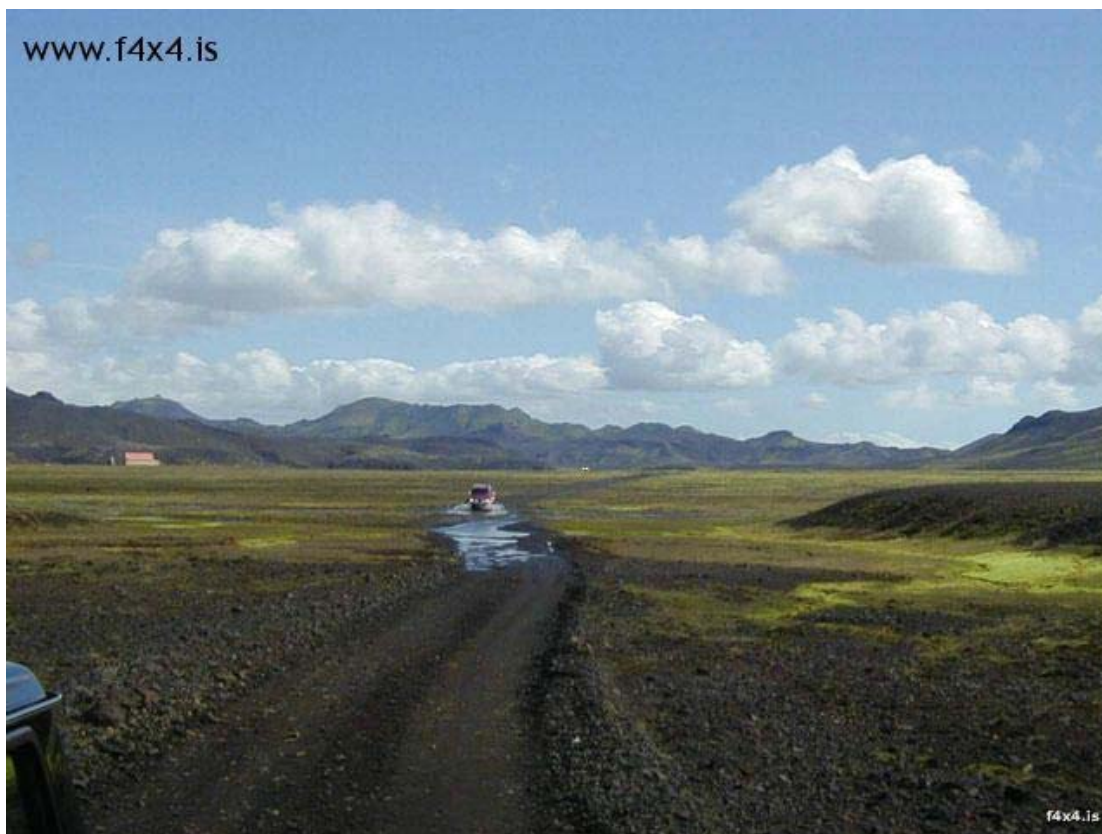
Hungurfit á Laufaleitum

Áhrif slóða á landslag eru breytileg eftir yfirborði og halla lands. Á grófum hraunum og á grófum melum eru slóðar oft lítt sýnilegir, en mjög sýnilegir á grónum svæðum, mosa, deiglendi, sandmelum og í lausu seti, t.d. vikrum. Á flatlendi getur verið erfitt að greina slóða en í halla, sérstaklega á grónum svæðum, verða slóðarnir mjög sýnilegir. Rétt staðsetning slóða með hliðsjón af yfirborði getur því skipt miklu máli.